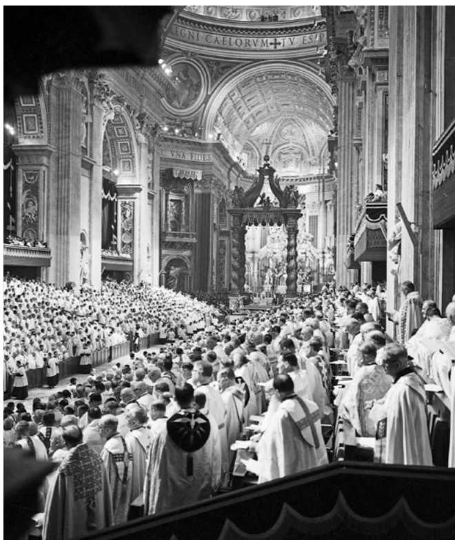
Basilique Saint-Pierre, Concile Vatican II (1962)